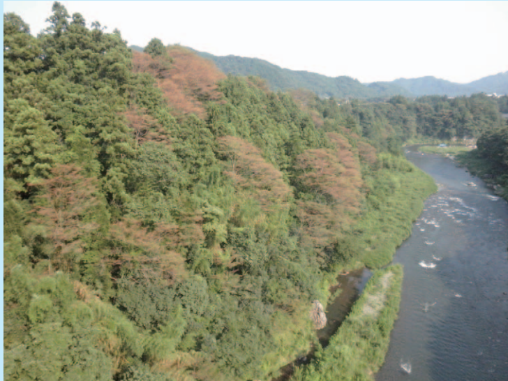
↑夏のさなかに茶色く枯れるケヤキの葉 (奥多摩橋から)

万年橋から西の地域で、ケヤキの木に異変が起きています。7月8月に二度葉っぱが茶色くなり、落ちてしまうのです。地元の方たちの数年に及ぶ観察から、これは「ヤノナミガタチビタムシ」という3ミリくらいの甲虫の被害だと分かってきました。市民が市役所にこのことを電話したら、何と！たらいまわし・・・市役所は環境の変化に対するアンテナが低いようです。ウメウィルスの発見が遅くなったのもこういう体質のせいではないか、とその方は怒っていました。